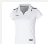
TK "Lara" weiß