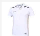
TK "Noah" weiß